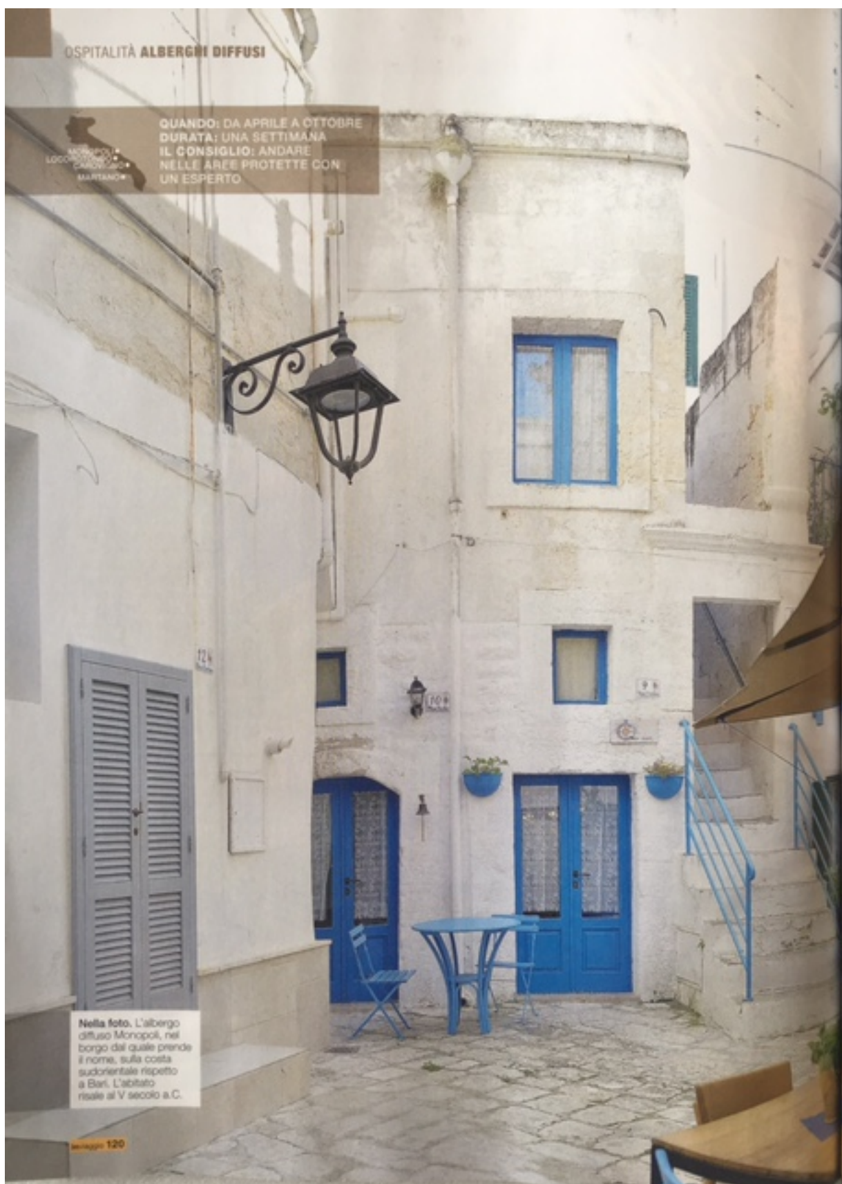
Nella foto, L'albergo diffuso Mottola, nel borgo dal quale prende il nome, sulla costa sudorientale rispetto a Bari. L'abitato risale al V secolo a.C.

QUANDO: DA APRILE A OTTOBRE DURATA: UNA SETTIMANA IL CONSIGLIO: ANDARE NELLE AREE PROTETTE CON UN ESPERTO